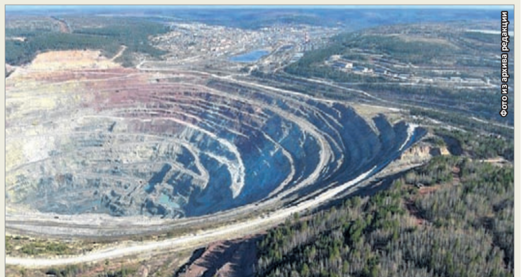
... и спустя более полувека эксплуатации

Первый массовый взрыв в карьере был произведён 3 марта 1961 года. И, хотя официальный день рождения карьера 30 декабря 1964 года — у горняков принято днём рождения карьера, рудника, разреза считать первый произведённый массовый взрыв. Это как праздничный салют за доблестный, самоотверженный труд, возвестивший о рождении ещё одного горнодобывающего предприятия. Первые экскаваторы ЭКГ-4 и буровые станки БС-1М монтировались на монтажной площадке в районе Кузнецовского ручья (старая база ОРСа). Экскаваторы перегонялись в карьер своим ходом, станки — с помощью буль-