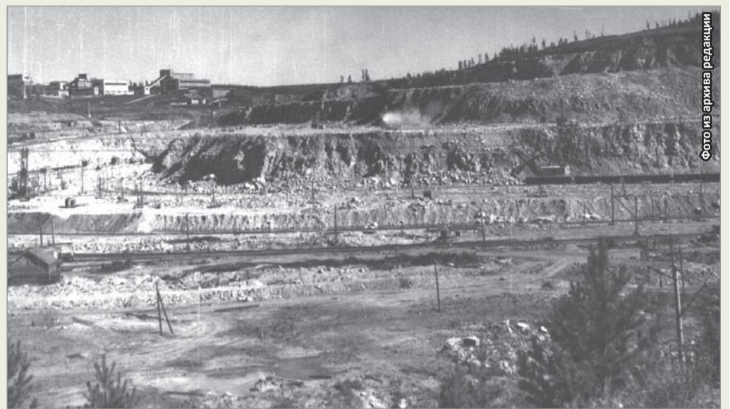
Коршуновский карьер в 70-е годы...